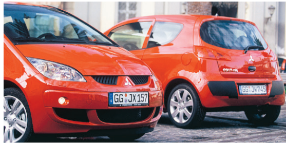
2005 års Mitsubishi Colt, och ovan till höger 1988 års upplaga. Modellen har också sålts i USA som Dodge Colt; till höger en bil från 1970.